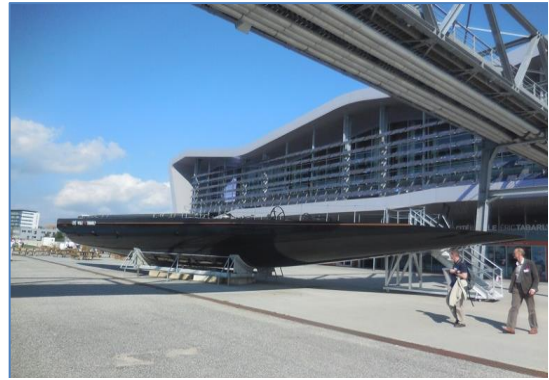
Pen Duik VI bateau d'Eric Tabarly

Pour la journée du vendredi, après une présentation de trois conférences avec pour thème " La place du Végétal dans les espaces naturels et la protection du Littoral ". Sujets forts intéressants, bien présentés, que nous verrons l'après-midi insitu. Déjeuner ensuite au Quai Ouest à l'Académie Eric Tabarly, célèbre navigateur.