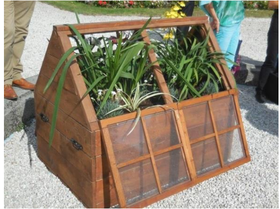
(type de bac employé pour ramener des jeunes plantes sur les vaisseaux)