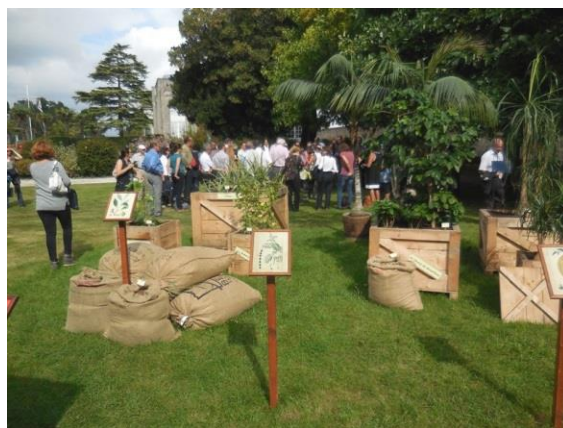
(Entrée de la Compagnie des Indes et exposition des différentes épices et plantes ramenées des Indes, du monde)

Les Anglais coulaient les bateaux français qui dans l'histoire perdaient tout. Les fonds de la Manche doivent être riche en cargaisons précieuses. Finalement ils délocalisèrent pour plus de sécurité et c'est dans le Morbihan que sera créé en 1664 la Compagnie des Indes ; un état dans l'état qui deviendra très important commercialement. Lors de ces voyages qui duraient quand même un an , beaucoup de marins mourraient, le scorbut faisant de grands ravages par manque de vitamines C. Finalement pour pallier à ce problème, les Français s'arrêtaient au Cap Vert pour y faire le plein d'eau douce (chaque homme à bords disposait de 3 lt / jour), acheter des esclaves qui une fois arrivés à Madagascar étaient employés dans les cultures de citrons que les Français avaient introduits. Cette halte obligatoire permettra ainsi aux équipages de refaire le plein de vitamines et d'arriver en bonne santé aux Indes (Chandigarh) ou en Chine