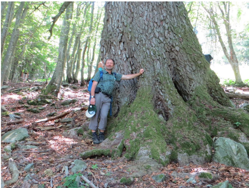
Weisstanne von Al Söö