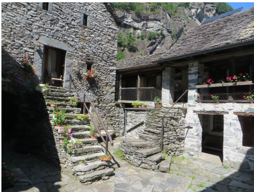
Dorfplatz von Sonlerto