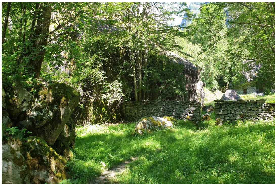
Steinmauern im val Bavona