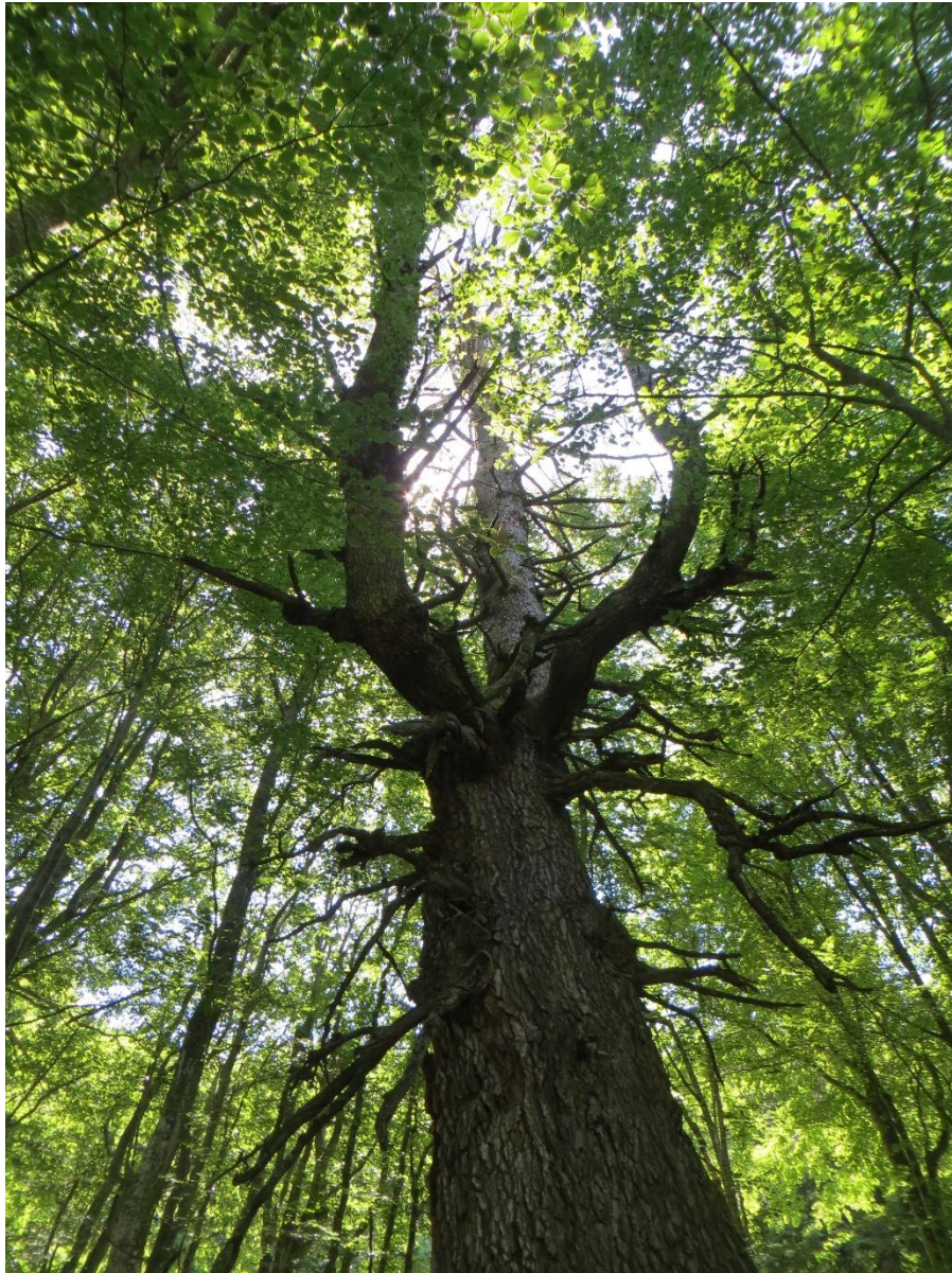
Der Methusalem im Kanton Tessin