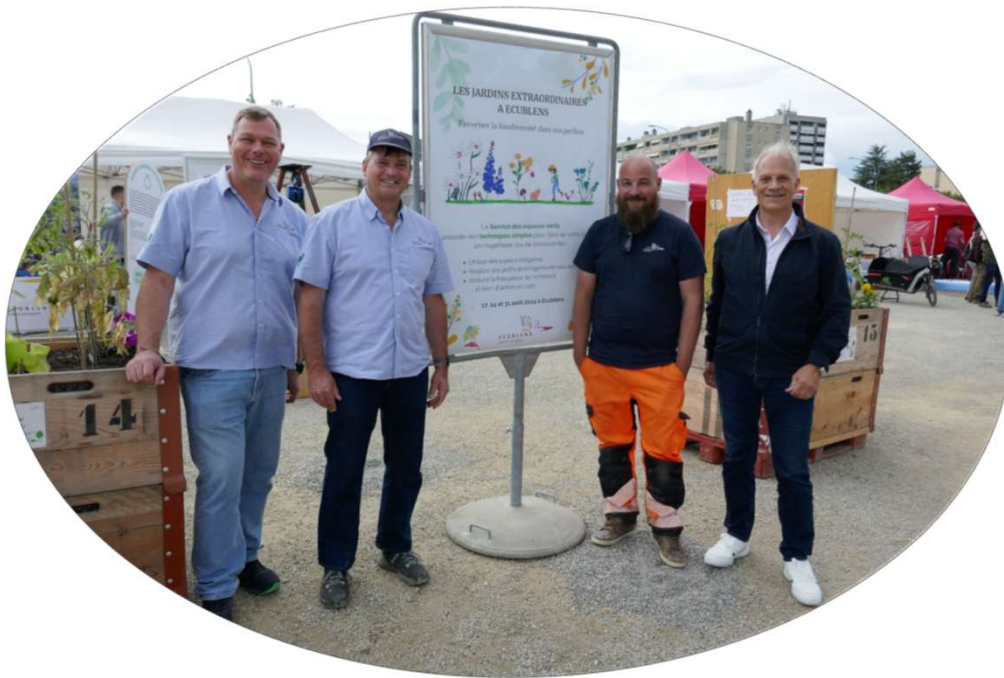
Ecublens STPE + Municipal