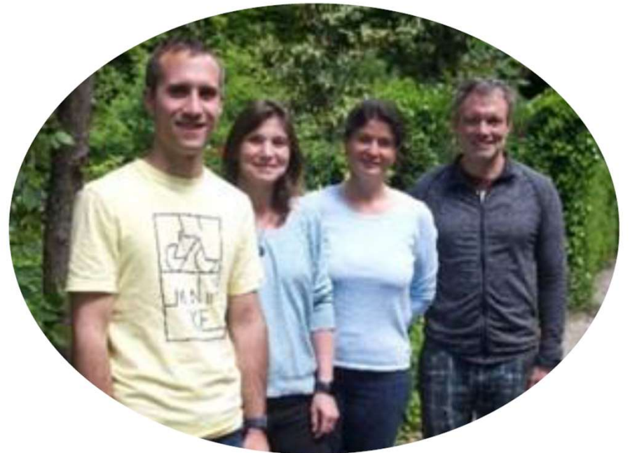
Sanu - projet de diplôme Conseillers en environnement