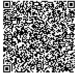
Sportanlagen Obere Au Terrains de sport Obere Au

Terrains de sport Obere Au, Grossbruggerweg 6