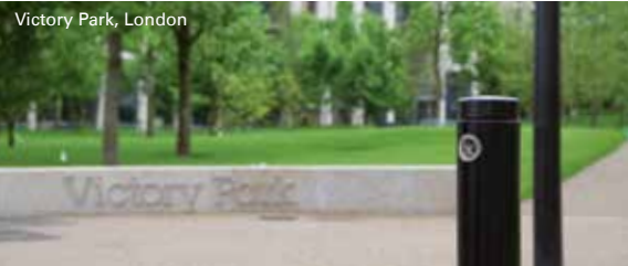
Victory Park, London

Schnell zu öffnen, leicht zu leeren - mit integriertem Ascher oder Hundebütelspender und als XL Version mit Mülltrennung.